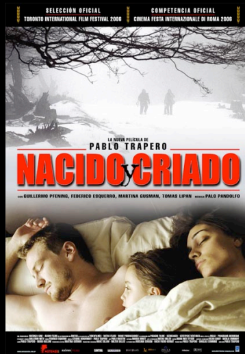
©Pablo Trapero - Afiche publicitario de Nacido y criado (2005)

Dispersión, territorio y cinematografía. El cine argentino reciente